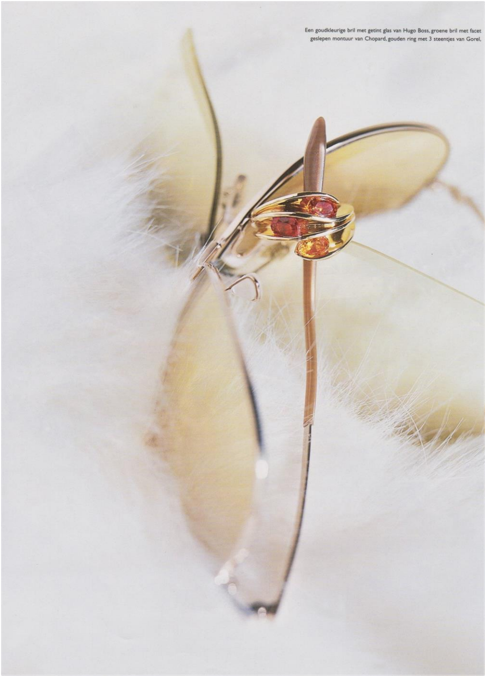
Een goudkleurige bril met getint glas van Hugo Boss, groene bril met facet geslepen montuur van Chopard, gouden ring met 3 steentjes van Gorel.