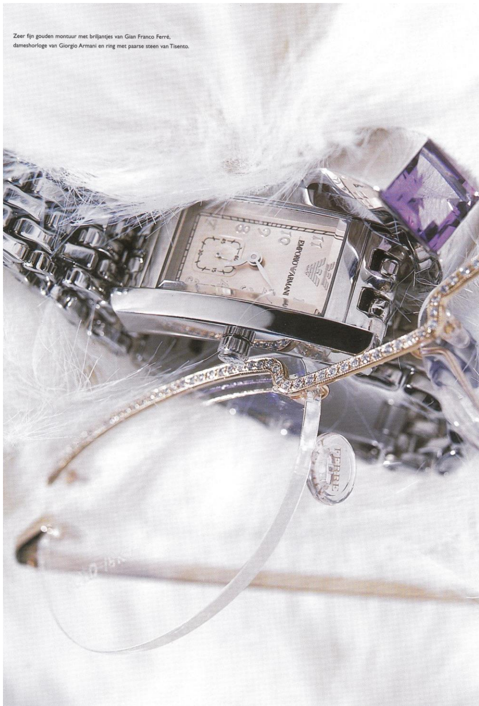
Zeer fijn gouden montuur met briljantjes van Gian Franco Ferré, dameshorloge van Giorgio Armani en ring met paarse steen van Tisento.