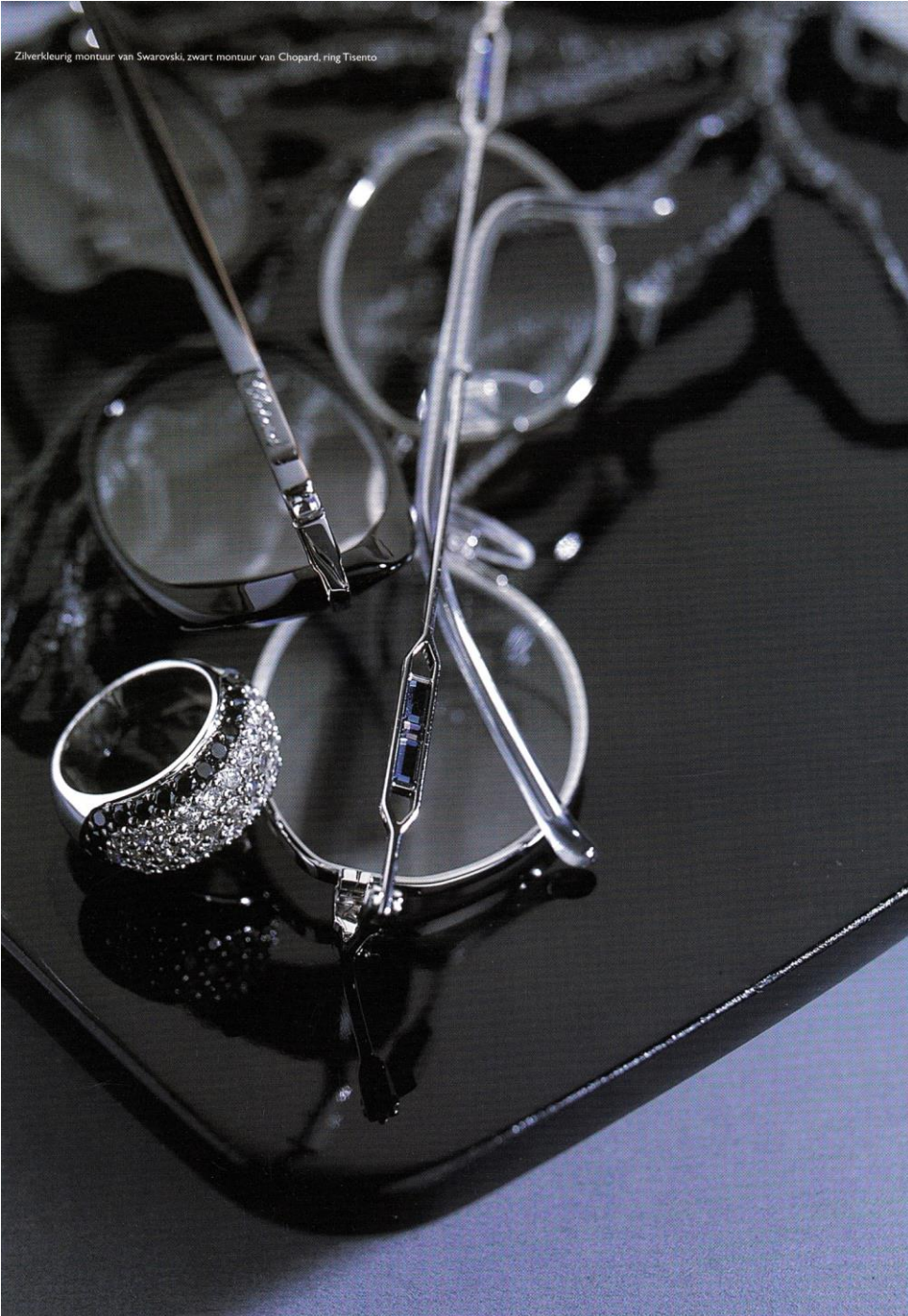
Zilverkleurig montuur van Swarovski, zwart montuur van Chopard, ring Tisento